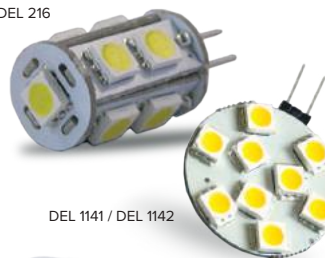
DEL 1141 / DEL 1142